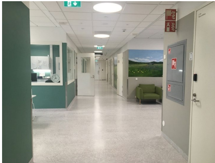
Kuva 2 Osaston käytävää

Osastojen pohjaratkaisuna on käytävä, jonka varrella ovat potilashuoneet ja osastolla J7 kaksi eristysluonetta. Käytävän halkaisee leveämpi poikittainen käytävä, joka toimii päiväsalina ja ruokailutilana. Hoitajien kanslia on melko keskellä kulmauksessa oleva suljettu ikkunallinen tila.