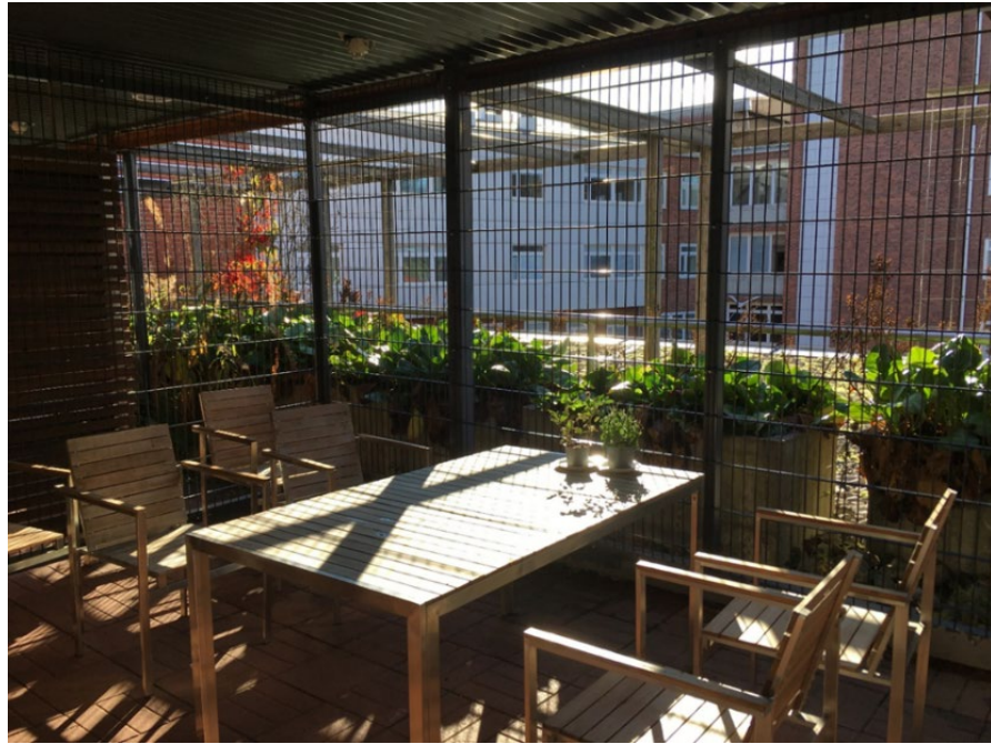
Kuva 10 Kuntoutusosaston ulkoiluterassi

Nuoriso-osastolla tarkastajille kerrottiin, että osastolla on ollut “jo vuosia” käytäntö, että nuoren ja vanhempien kanssa sovitaan, ettei osaston ulkopuolelle pääse muutoin kuin hoitajan kanssa. Poikkeuksena tästä voidaan sopia, että esimerkiksi kouluun voi liikkua itsenäisesti.