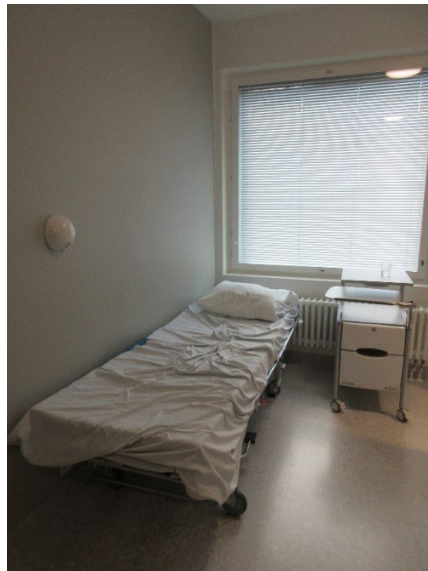
Kuva 6 Potilashuone

Myös potilashuoneet olivat pelkistettyjä. Potilaat toivat esille, että ainakaan kaikissa huoneissa ei ollut kelloa, vaikka he ovat sellaista toivoneet.