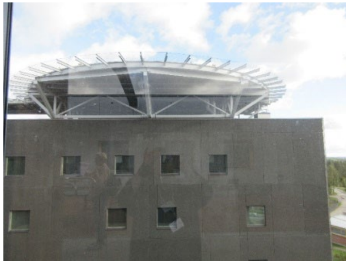
Kuva 9 Helikopterikenttä

Ulkoilualan välittömässä läheisyydessä viereisen rakennuksen katolla oli helikopterin laskeutumispaikka. Helikopterin laskeutuessa katolle on ulkoilualueelta poistuttava. Tarkastajille jäi jossain määrin epäselväksi miten tällainen ennakoimaton ja äänekkäs tapahtuma mahdollisesti vaikuttaa potilaisiin.