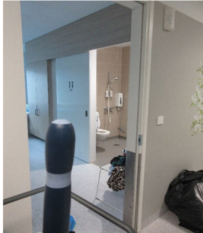
Kuva 7 Näkymä käytävältä potilashuoneeseen

Tarkastuksen aikana useisiin yhden hengen huoneisiin oli kuitenkin sijoitettu kaksi potilasta ylipaikkatilanteen vuoksi. Kahdelle potilaalle tila oli ahdas eikä tarkastajille syntyneen käsityksen mukaan yksityisyyttä voitu turvata. Sänkyjen välillä ei ollut esimerkiksi sermiä. Joidenkin huoneiden osalta oli myös ongelmia siinä, että kun sekä huoneen ovi että wc-/suihkutilan ovi olivat auki, näki käytävältä suoraan wc-/suihkutilaan.