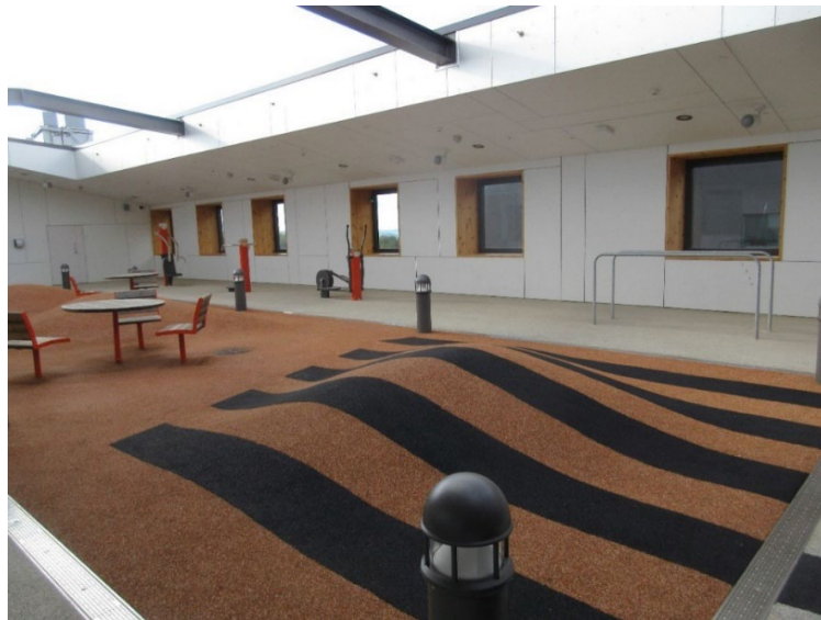
Kuva 8 Katolla oleva ulkoilualue

Ulkoilualan välittömässä läheisyydessä viereisen rakennuksen katolla oli helikopterin laskeutumispaikka. Helikopterin laskeutuessa katolle on ulkoilualueelta poistuttava. Tarkastajille jäi jossain määrin epäselväksi miten tällainen ennakoimaton ja äänekkäs tapahtuma mahdollisesti vaikuttaa potilaisiin.