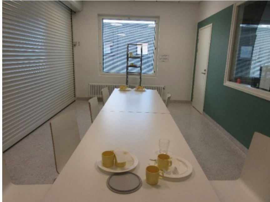
Kuva 3 Turvakaihdin alhaalla

Kaikilla päärakennuksen osastoilla oli yhteisissä tiloissa keittiöseinäke. Pääsääntöisesti keittiön edessä oleva turvakaihdin vaikutti olevan osastoilla kiinni. Tätä tarkastajille perusteltiin avoimen keittiön aiheuttamilla riskeillä. Niillä osastoilla, joilla keittiö oli avoinna, osaston yleisilme ei ollut yhtä karu. Tarkastajat kokivat, että vapaammin käytössä oleva keittiö voisi lisätä osastojen viihtyvyyttä sekä toiminnallisuutta.