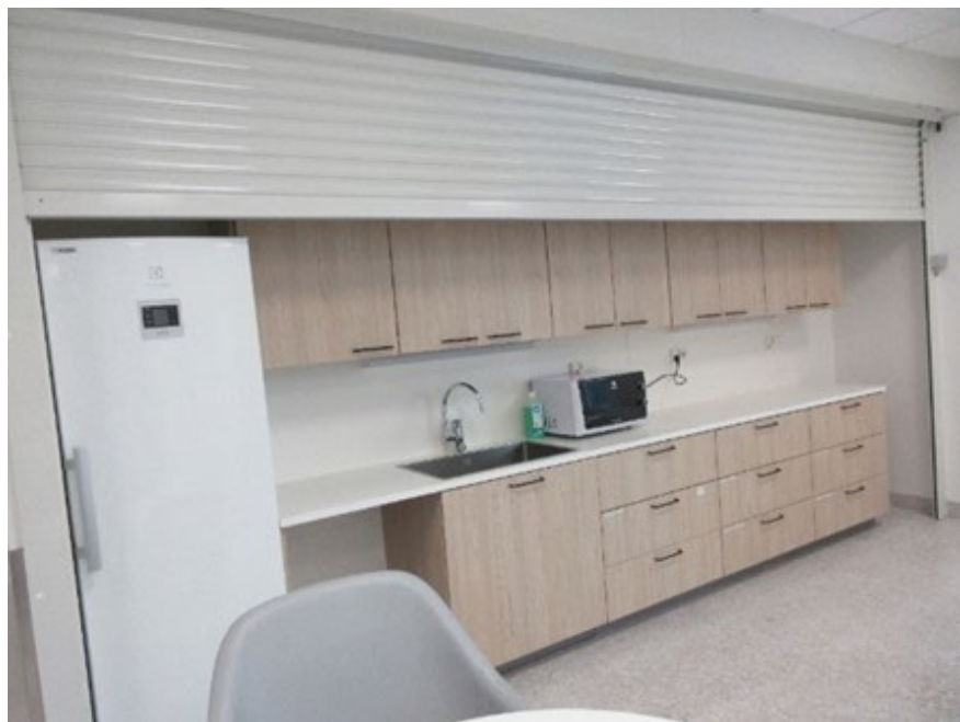
Kuva 4 Turvakaihdin ylhäällä