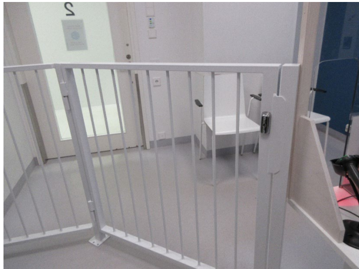
Kuva vastaanottohuoneesta, jossa metallisen portin takana on potilaalle varattu tila. Oikealla puolella näkyy hieman hoitajan työpistettä.

Tarkastajien tutustuessa tiloihin, yhden vastaanottohuoneen hoitajan puoleinen ovi oli avoinna siten, että huoneeseen näki suoraan sisään. Hoitaja oli poistunut tietokoneelta ilman, että hän oli lukinnut sitä. Avoinna olleet tiedot näkyivät käytävälle. Huoneessa oli myös hoitotarvikkeita. Potilas istui yksin huoneessa. Hänen olisi halutessaan ollut mahdollista ottaa näitä tarvikkeita sekä mahdollisesti nähdä tietokoneen ruudulle.