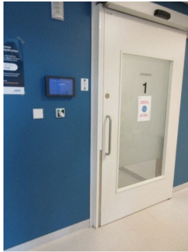
Kuvassa ovi, josta potilas menee ensiarvioon vastaanottohuoneeseen.