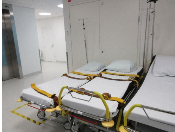
Kuva aulasta, jossa oli 2 leposidevalmiudessa olevaa sänkyä.