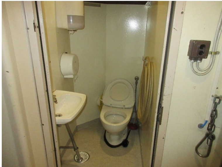
Kuva 2: WC-koppi