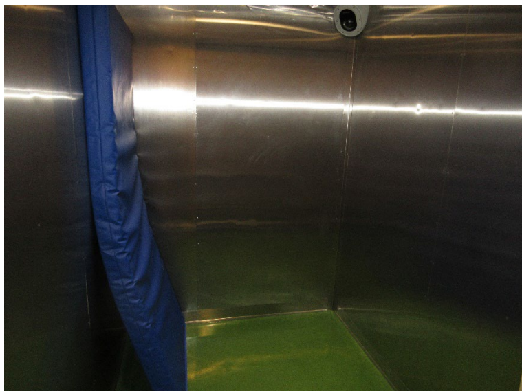
Kuva 3: Naisille varattu selli 2