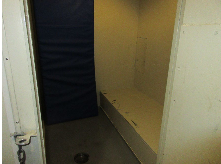
Kuva 1: Selli 1

Aluksella on kolme vapautensa menettäneiden säilytyshuonetta (selliä), kaikki sijaitsevat kannella 7. Kaksi säilytyshuoneista on saman oven takana ja tilassa oli näiden säilytyshuoneiden käyttöön yksi pieni wc-koppi, jossa ei ollut ovea. Yksi selleistä sijaitsi hieman erillään, käytävän toisella puolen ja se oli varattu naispuolisille säilöön otetuille. Naisten käytössä oli myös oma erillinen tilavampi wc heidän sellinsä vieressä.