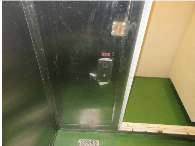
Kuva 5: Hälytysnappi

Sellit olivat varsin pieniä ja varustuksena oli patja, hälytysnappi, valvontakamera ja Elocare valvontalaite. Viimeksi mainitulla voidaan tarkkailla tutkateknologian avulla vapautensa menettäneiden liikkeitä ja hengitystä. Säilytyshuoneen ovesa oli myös ovisilmä, jonka kautta pystyi tarkkailemana vapautensa menettänyttä. Hälytysnappiin yltää myös lattialta, mutta sen kautta ei ole mahdollisuutta puheyhteyteen. Valvontakameran kuva välittyy komentosillalle, järjestyksenvalvojen esimiesten toimistoon ja järjestyksenvalvojen tiloihin. Järjestystenvalvojen tilat eivät sijaitse säilytystilojen yhteydessä vaan kaksi kantta ylempänä, kannella yhdeksän. Komentosillalla kamerakuvaa ei seurata aktiivisesti, vaan tähytstäjä tarkistaa tilanteen ainoastaan, jos säilytystilasta tulee hälytys. Tallenteet säilyvät ilmeisesti kaksi viikkoa. Järjestyksenvalvojat voivat katsoa tallenteita järjestelmästä, mutta he eivät pysty muokkaamaan tai poistamaan niitä.