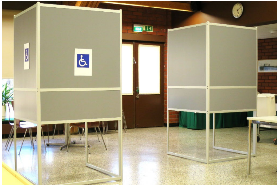
Kuva 2. Äänestyskopit, joista toinen oli esteetön

Äänestyspaikkana oli sotilaskodin yhteydessä sijaitseva Vaakunasali. Tilassa ei ollut samaan aikaan muuta toimintaa. Tila oli riittävän suuri ja rauhallinen äänestyspaikaksi. Tila oli yleisesti tuttu äänioikeutetuille henkilöille, joten sinne ei ollut järjestetty erillistä ohjausta. Hattulan kunnan hallintosihteeri järjesteli äänestystilaa yhdessä vaalitoimikunnan kanssa ennen äänestyksen alkua. Kunta oli tuonut paikalle kaksi äänestyskoppia, joista toinen oli esteetön. Äänestyskopit oli sijoiteltu siten, että vaalisalaisuus oli turvattu. Äänestyskopeissa oli sekä lyijykynä että kuivamustekynä. Kopin seiniltä löytyi myös ehdokaslistat- ja kirjat sekä ohje äänestäjälle äänestysmerkinnän tekemiseksi. Vaalitoimikunnalla oli tarjolla suurennuslasi.