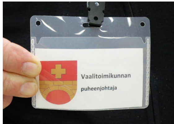
Kuva 3. Vaalitoimikunnan puheenjohtajan tunnistelappu

Äänestyspaikalla oli Hattulan kunnan ja Kanta-Hämeen hyvinvointialueen ehdokkaiden ehdokaslistat sekä oikeusministeriön ehdokaskirjat, joissa oli tiedot valtakunnallisesti molempien vaalien kaikista ehdokkaista.