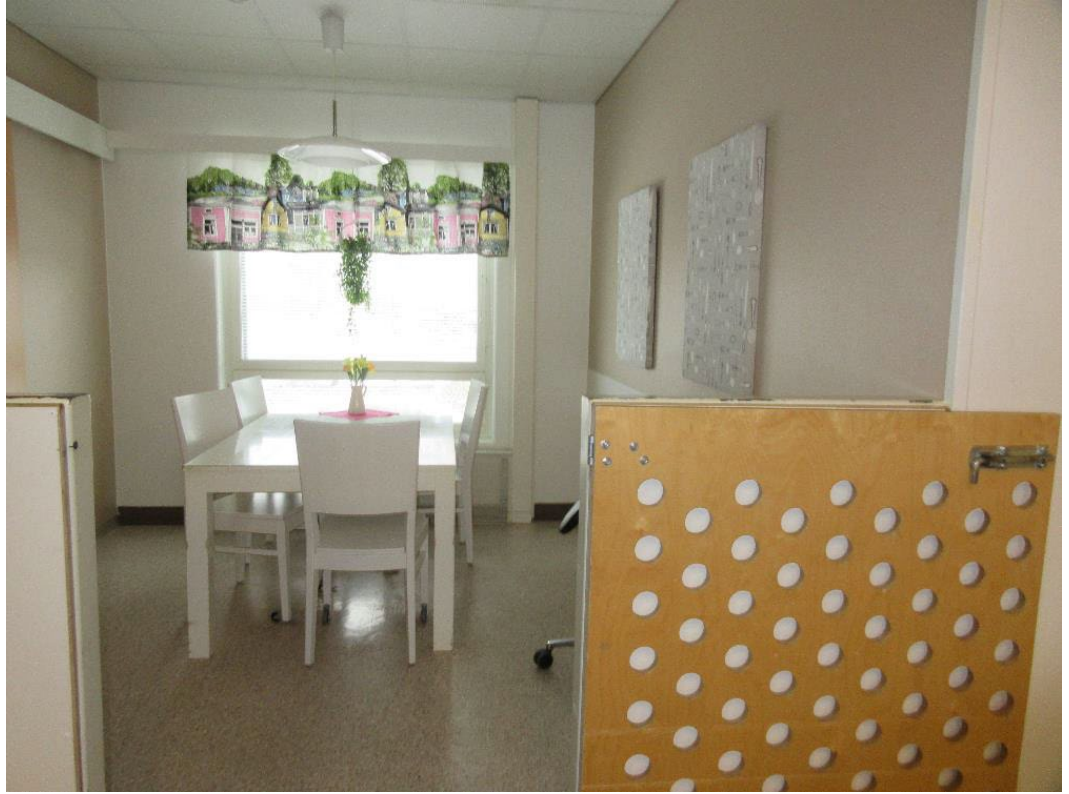
Kuva 7. Ruokailutila