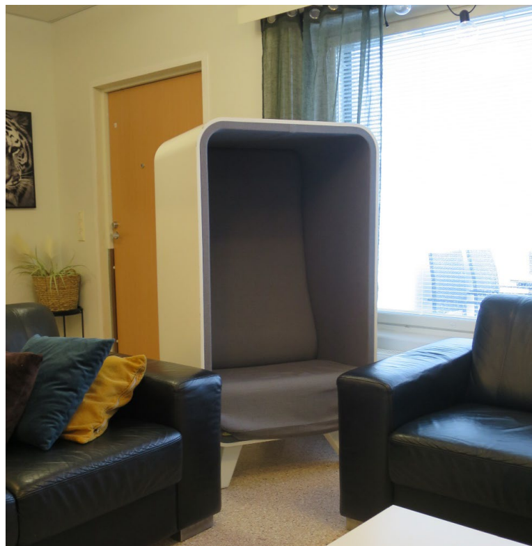
Kuva 3. Tuoli oleskelutilassa

Ovisilmät on käännetty toisin päin ja siten niiden käyttö asiakashuoneeseen suuntautuen on estetty.