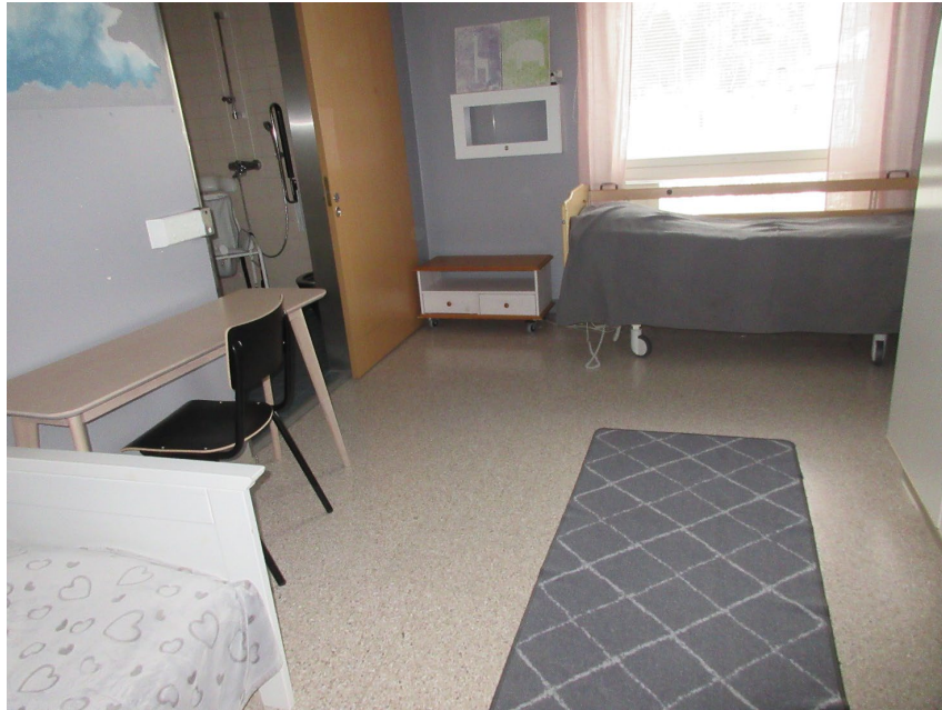
Kuva 4. Asukashuone