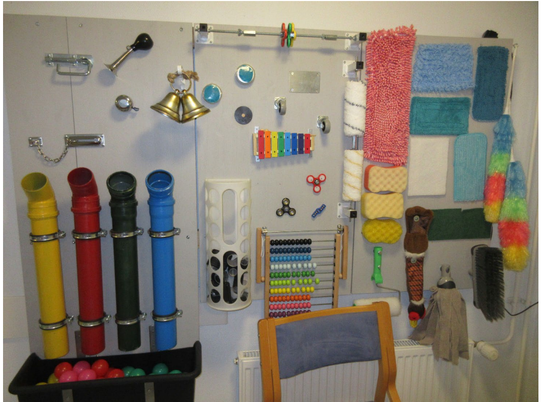
Kuva 8. Aistiseinä