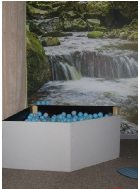
Kuva 6. Akvaariotilan pallomeri