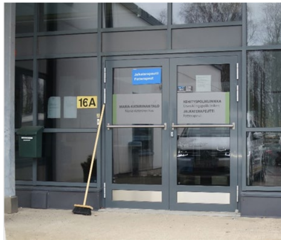
Kuva 1. Sisäänkäynti