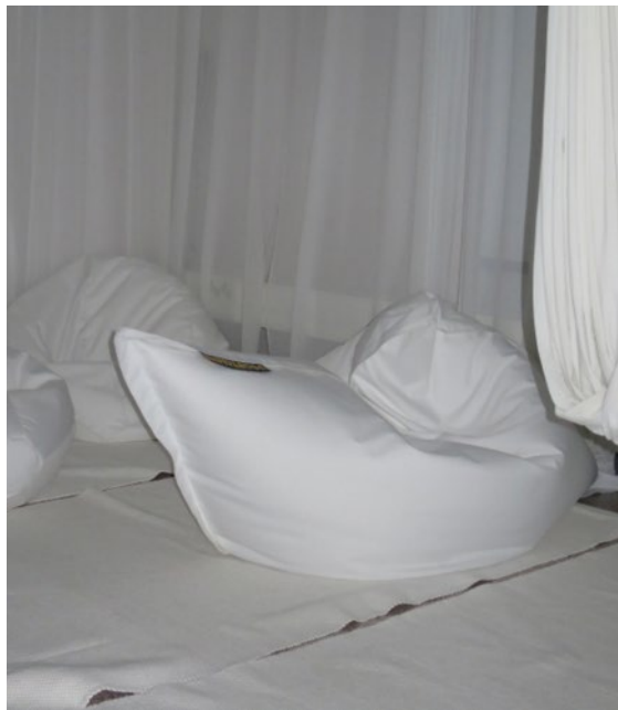
Kuva 5. Valkoinen huone