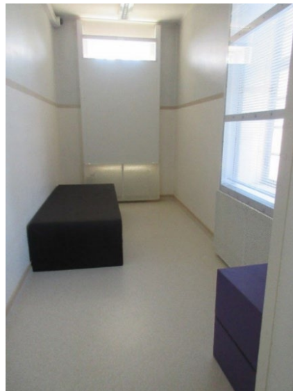
Osaston V1 eristystila.

Osastolla P3 käytettiin leposide-eristystä harvoin. Lepositesänkyä säilytetään osastolle tulevassa aulassa peitettynä tilan puutteen vuoksi.