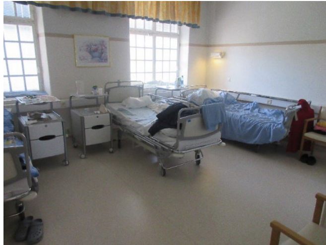
Kuvassa potilashuone osastolla V1.

Joissakin osaston P1 huoneissa oli kaappeja, joita potilas ei saanut lukkoon eli hänellä ei ollut mitään turvallista paikkaa säilyttää tavaroitaan huoneessa. Ainakin yhdessä huoneessa kaappi oli hajoamisasteessa, minkä vuoksi sitä ei voitu käyttää. Toisesta saman huoneen kaapista oli ovi otettu kokonaan pois ja potilaan omaisuus oli sijoitettuna avohyllylle – potilas kertoi säilyttävänsä muun muassa hoitosuunnitelmaansa tässä kaapissa. Yhdessä huoneessa potilas oli toisen potilaan mukaan ollut lomalla viikon ja hänen vuoteensa oli edelleen petaamatta. Myös osastolla P3 todettiin potilashuoneen kaapista puuttuvan ovi.