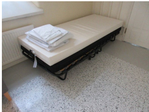
Kuvassa varalla olevia retkisänkyjä osastolla M1.