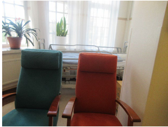
Kuvissa osaston P1 käytävällä ja osaston V1 oleskelutilassa varasängyt.