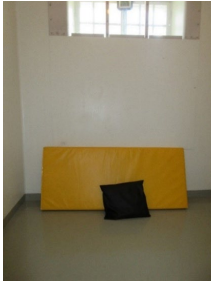
Osaston P3 eristystila.