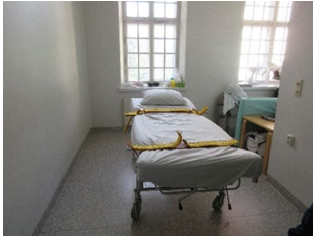
Kuvassa osaston J1 eristystila.