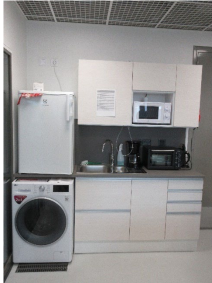
Kuvassa perhe- ja nuoriso-osaston keittiötilat.

Perhe- ja nuoriso-osaston sellit olivat tilavat ja yhteiset oleskelutilat olivat varsin viihtyisät. Osastojen keittiötilat olivat pienet ja varustelu oli valitettavasti hyvin vaatimaton, esimerkiksi uuni puuttui kokonaan. Ruoan valmistus on vakiintuneesti ollut monille vangeille tärkeä ja mielekäs vapaa-ajan toiminnan muoto. Apulaisoikeusasiamies toteaa, että myös perhe- ja nuoriso-osastolla olisi perusteltua olla normaalit mahdollisuudet ja puitteet ruoan valmistamiseen, jotta osastoille sijoitetut vangit voivat harjoitella ja ylläpitää arjen taitojaan vapautumista ajatellen. Keittiön puutteita lukuun ottamatta osastot oli muutoin varusteltu asianmukaisesti niiden käyttötarkoituksen huomioiden.