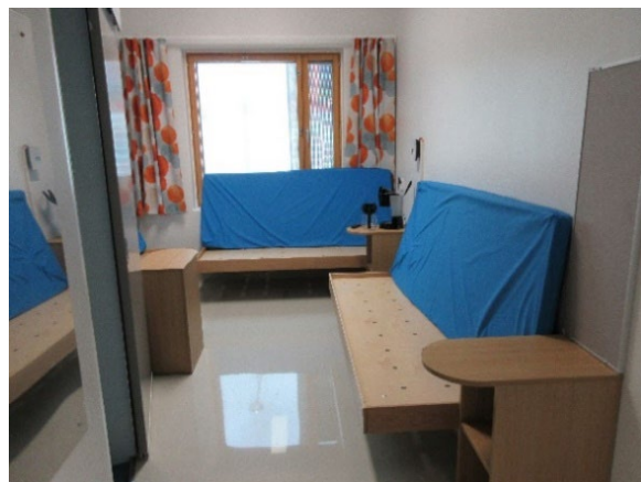
Kuvassa matkasellin sisustusta.

Matkasellit olivat siistit ja niissä oli wc-tila, televisio ja radio. Tiloissa ei näkynyt minkäänlaisia kirjoituksia seinillä. Matkaselliosastolla oli erillinen suihkutila ja poikkeuksellisen hyvä ulkoilutila. Ulkoilupihalla oli sadekatos, muutamia kuntoiluvälineitä ja näkymä ympäristöön. Ulkoilupihoilla ei ollut penkkejä istumista varten.