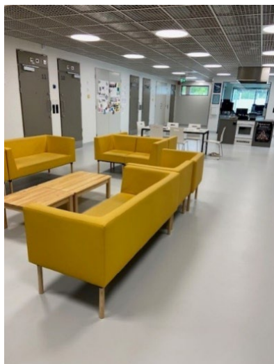
Kuvassa asuinosaston yleisiä oleskelutiloja.

Kaikki asuinosastot olivat samankaltaisia. Tilavat oleskelualueet mahdollistavat hyvin vankien keskinäisen yhdessäolon. Sellien lisäksi televisio löytyi myös yhteisistä oleskelutiloista. Jokaisen osaston yhteydessä oli ryhmätyötila (esimerkiksi opetusta ja koulutusta varten). D2-osaston ikkunallista ryhmätyötilaa käytetään myös henkilökunnan toimesta. Ruokailu tapahtuu osastolla, mutta päiväjärjestyksen mukaan B2-osaston vangit ruokailevat omissa selleissään. Keittiötila oli avara ja mahdollistaa hyvin myös omatoimisen ruoanlaiton.