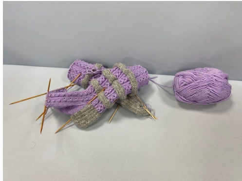
Kuvassa vangin keskeneräinen neulontatyö asuinosaastolla.

Vankilan johto tiedosti toimettomuuden suljetuimmilla osastoilla ja suhtautui hyvin myönteisesti ratkaisujen etsimiseen tilanteen parantamiseksi. Vankilassa kehitetään aktiivisesti uusia toimintamuotoja erityisesti naisvankien tarpeisiin. Lisäksi osastojen yhteisten tilojen ja luokahuoneiden käyttömahdollisuuksia pyritään entisestään lisäämään. Apulaisoikeusasiamies pitää toimenpiteitä oikeansuuntaisina.