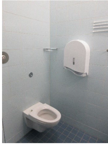
Kuvassa matkasellin wc-tila.