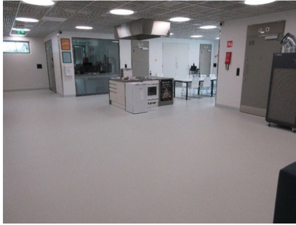
Kuvassa asuinosaston yleisiä oleskelutiloja.

Osastokansliat olivat ns. lasikoppeja, jonne vangeilla on esteetön näkymä. Tarkastuksella saadun tiedon mukaan virkamiehiä on ohjeistettu huomioimaan tietoturvaan ja -suojaan liittyvät seikat (esimerkiksi vankien nähtävillä ei saa olla nimitietoja sisältäviä papereita).