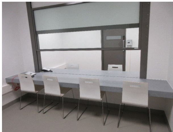
Kuvassa tapaamistilan pleksi on nostettu puoleen väliin.

Valvottuja tapaamisia ja asiamiehen tapaamisia varten vankilassa oli kaksi tapaamistilaa, joissa vangin ja tapaajan välillä on rakenteellinen este (ns. pleksi). Pleksit saa sähköisesti nostettua ylös tarpeen mukaan. Tarkastuksella saadun tiedon perusteella tapaamistilat ovat vankien tarpeisiin nähden riittävät, koska tapaamiskulttuuri on muuttunut ja videotapaamisia järjestetään nykyisin aiempaa enemmän. Tarvittaessa liikuntasali on mahdollista varustaa siten, että sitä voidaan käyttää myös valvottuna tapaamistilana. Lisäksi vankilasta löytyi tapaamistila videoneuvotteluja varten.