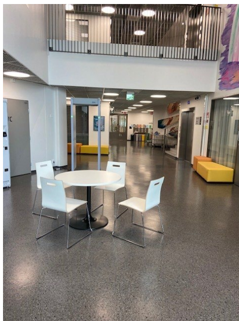
Kuvassa yleisistä tiloista ja käytävältä avautuva näkymä B1-osastolle.

Asuinosastojen ovissa oli isot ikkunat käytäville. Erityisesti B1-osastolla havaittiin, että yleisissä tiloissa ja käytävillä liikkuvat henkilöt (esimerkiksi kanttiiniautomaattia käyttävät vangit ja muut vankilassa vierailijat) näkevät suoraan osastolle. Tarkastuksella saadun tiedon mukaan osastojen oviin olisi suunnitteilla osittainen näkösuoja (esimerkiksi himmentävä kalvotus), joka peittäisi ikkunan alaosan mutta jättäisi virkamiehille riittävän näkymän osastolle. Apulaisoikeusasiamies pitää toimenpidettä tarpeellisena.