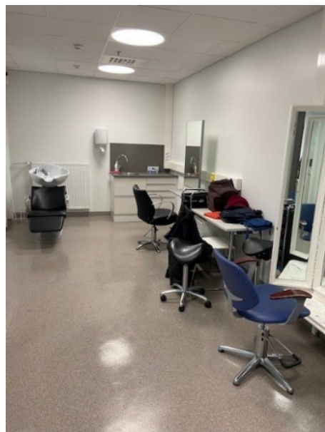
Kuvassa vankilan wellness-tila.

Naiserityisyys oli huomioitu laajasti sekä toiminnassa että tiloissa. Naisille kohdennettuja palveluita ja tukitoimia on kehitetty muun muassa kouluttamalla henkilöstä ja lisäämällä restoratiivista työtettä. Vankilassa oli esimerkiksi wellness-tila, jossa vangit voivat muun muassa värjätä hiuksiaan ja tehdä muita kauneudenhoitoon liittyviä toimenpiteitä, kuten jalkahoitoja. Lisäksi kampaajaopiskelijat käyvät vankilassa noin kerran kuussa tekemässä hiusten leikkauksia 15 euron hintaan (sisältää leikkauksen, pesun ja viimeistelyn). Wellness-tilaa voi mahdollisuuksien mukaan jatkossa hyödyntää myös muunlaiseen kauneudenhoitoalan koulutustoimintaan.