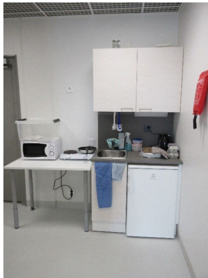
Kuvassa perhe- ja nuoriso-osaston keittiötilat.