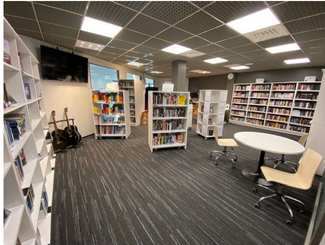
Kuvassa yleisnäkymä kirjastosta.

Tarkastushetkellä lakikirjat olivat lainassa. Oikeusasiamiehen vuosikertomuksia ei ilmeisesti löytynyt kirjaston valikoimasta. Oikeusasiamiehen kanslia lähettää vankiloihin vuosittain kappaleet vankien kirjastoa varten.