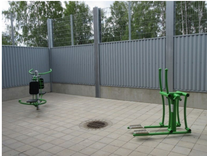
Kuvassa ulkoilupihan kuntoiluvälineet.

Tarkastuksella saadun tiedon mukaan vangit ovat matkasellissä vain lyhyen aikaa ja lähtökohtaisesti he pääsevät asuinosaan viimeistään seuraavana päivänä. Toimintatapaa voidaan pitää myönteisenä. Tarkastuspäivänä matkaselleissä oli yksi vanki, joka tarkastuksen aikana päästettiin hänen omasta pyynnöstään tupakoimaan ulkoilupihalle.