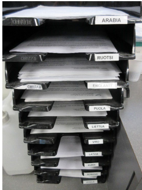
Kuva1: Materiaalia vapautensa menettäneiden oikeuksista oli saatavilla monilla kielillä

Poliisilaitos ilmoitti edellisen tarkastuspöytäkirjan havaintojen johdosta varmistavansa, että jatkossa vapautensa menettäneille annetaan vaadittava materiaali ja että tästä tehdään asianmukaiset kirjaukset poliisiasiain tietojärjestelmään.