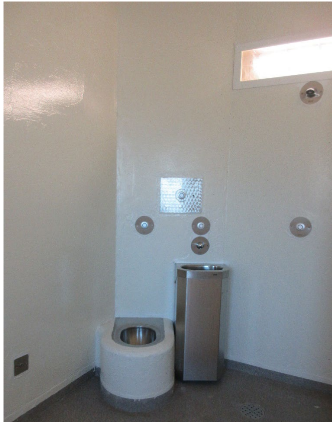
Kuva: Invasellin wc ja suihkutila

Tällä tarkastuksella tehtyjen havaintojen mukaan invasellien tilanne on sama kuin edellisellä tarkastuksella. Saadun selvityksen mukaan esteettömyyskartoituksesta on ollut puhetta, mutta sitä ei ole vielä toteutettu.