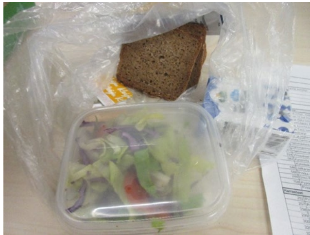
Kuvassa iltaruokaan kuuluva salaattiannos pienessä rasiassa, 2–3 ruisleipäviipaletta, margariininappi sekä 2 dl maitoa.