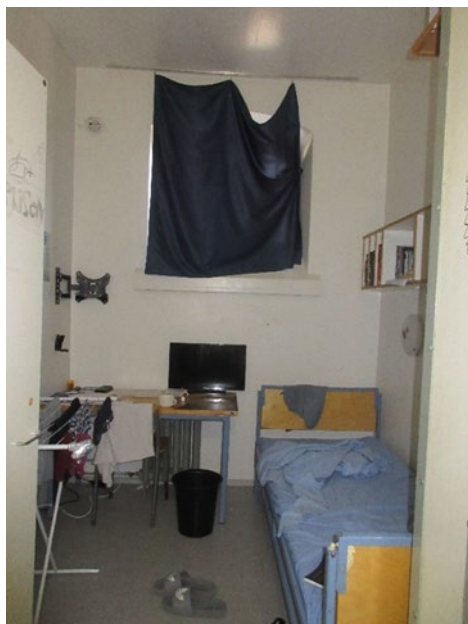
Kuvassa vangin selli, jossa pöytä, tuoli, sänky ja pieni seinähyllä.