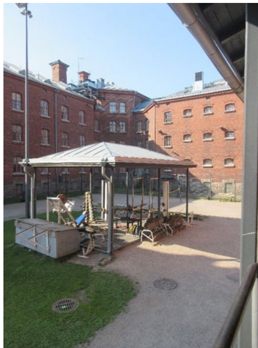
Kuvassa ulkoilupiha, jossa osasto B13 alaikäiset vankeusvangit ulkoilevat. Ulkoilupiha ei ole erityisen pieni, mutta vankilarakennus ympäröi sitä kolmelta sivulta ja neljännellä sivulla näkemäesteenä on aita, joten tunnelma myös pihalla on suljettu.