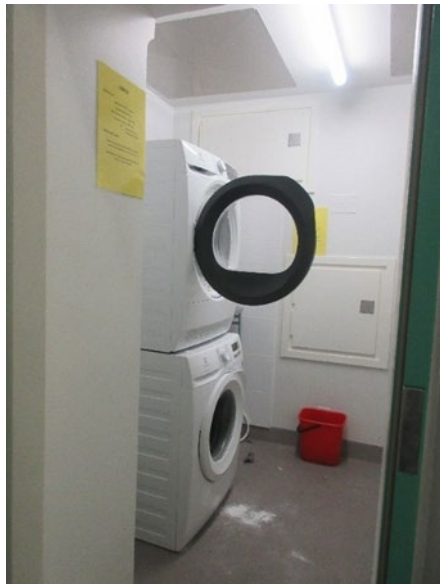
Kuvassa huone, jossa pesukone ja kuivausrumpu.

Osastokeittiössä vaikutti olevan hyvin suppea valikoima ruoanvalmistusvälineitä, muun muassa vain pari kattilaa ja paistinpannu, joita näkyy seuraavissa kolmessa kuvassa.