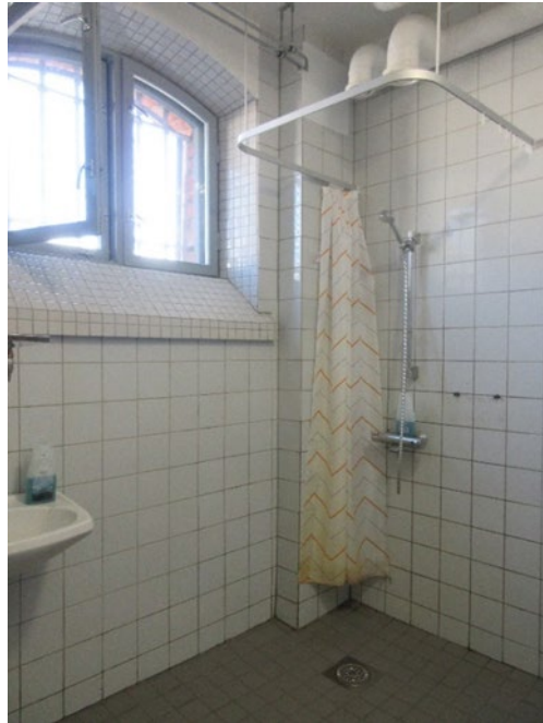
Kuvassa osaston vankien yhteinen suihkuhuone