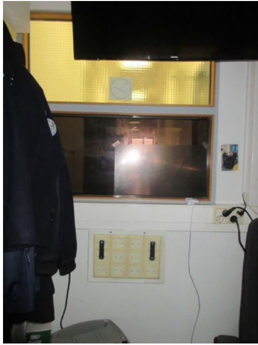
Kuvassa osasto-ovalvomossa oleva pieni ikkuna, josta on näkymä osaston B13 käytävälle.