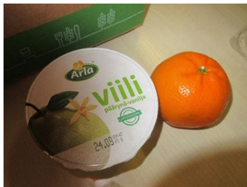
Kuvassa iltapalaksi tarkoitettu purkillinen viiliä ja mandariini.