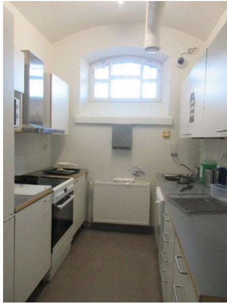
Kuvassa vankien vapaa-ajankäytössä oleva käytävämallinen keittiö.