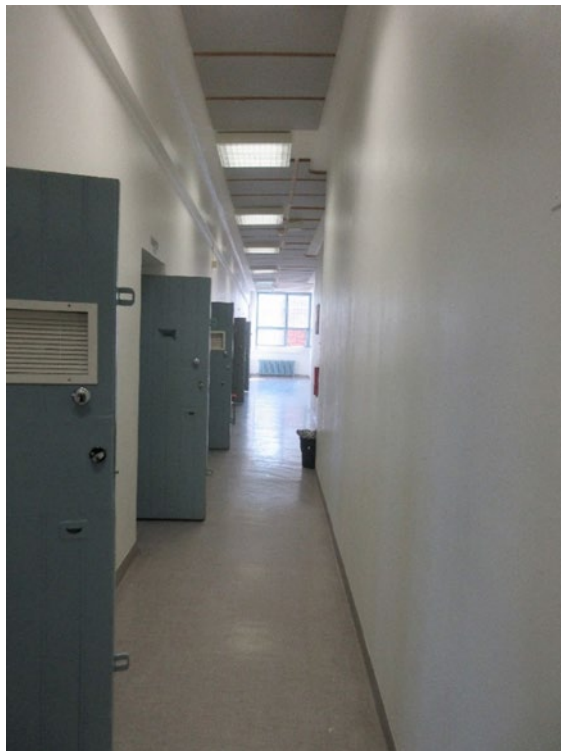
Kuvassa osaston B 13 käytävä osastolle sisään tullessa, osasto-ovalvomosta päin katsottuna.