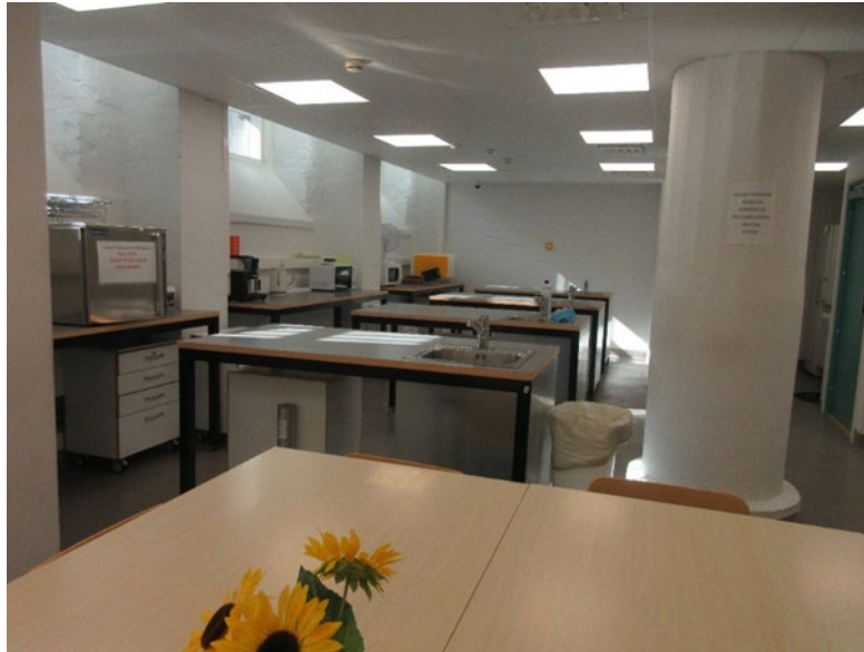
Kuvassa opetuskeittiön tiloja.