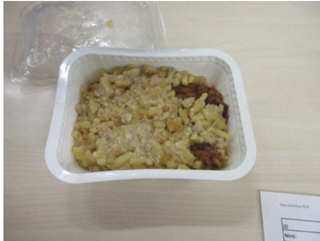
Kuvassa tutkintavangille iltaruoksi rasiaan pakattuna tullut ruoka-annos, joka vaikuttaa olevan kiusaustyyppistä ruokaa.