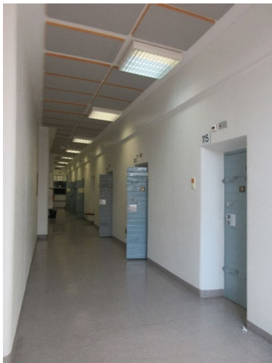
Kuvassa osaston B13 käytävä vastakkaisesta suunnasta, osastovalvomoon ja osaston ovelle päin katsottaessa.