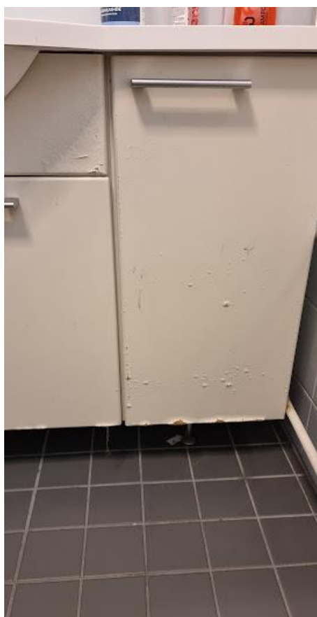
Kosteudesta kärsinyt kaapisto